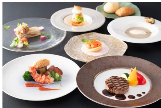
オマール海老 & 牛フィレコースディナー