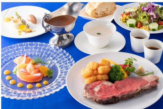
国産牛ローストビーフディナー