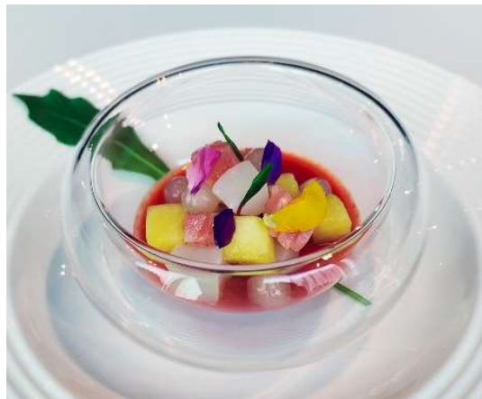
アミューズ(イメージ)

https://www.tablecheck.com/shops/tokyuhotels-haneda-flyerstable/reserve?menu_lists[]=637d9f214e6b2f002521f626