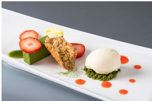
八女茶のテリーヌとあまおう莓、バニラアイスと共に