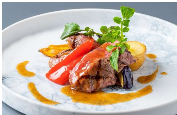
博多和牛サーロインの網焼き 九州野菜添え ナチュラルなジュと共に