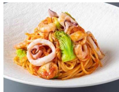
福岡県産一本槍とシバエビのトマトスパゲティ