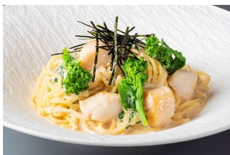
福岡県産辛子明太子と帆立のクリームスパゲティ

[内容] 福岡県産辛子明太子と帆立のクリームスパゲティ 2,100円／はかた地どりと福岡県産茸と砂肝の和風スパゲティ 1,800円／福岡県産一本槍とシバエビのトマトスパゲティ 2,000円