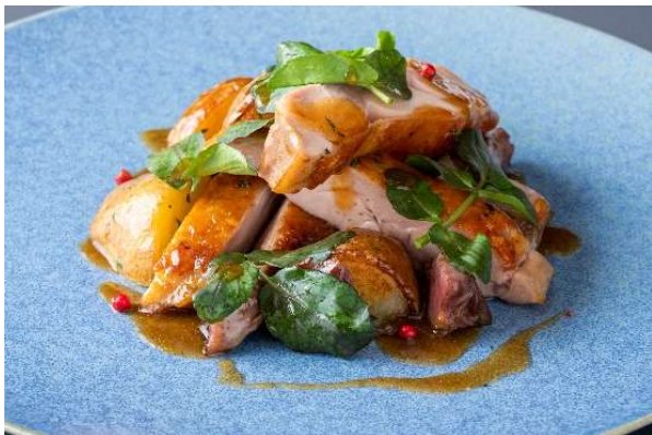
はかた地どりの網焼き 砂肝のコンフィーとジャガイモ添え

[内容] 冷前菜／温前菜／メイン(3種類からお選びいただけます)／デザート／コーヒー