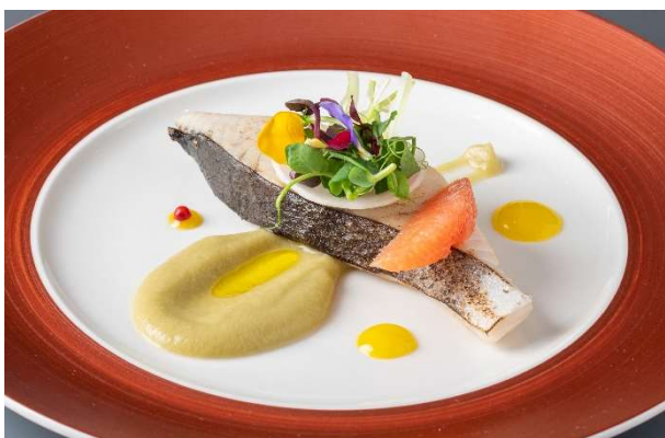
糸島産特鮮本鱈のコンフィー 博多茄子のピューレ 柚子胡椒風味

[内容] アミューズ／冷前菜／温前菜／魚料理(糸島産特鮮本鱈)／メイン(博多和牛)／デザート／コーヒー