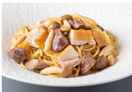
はかた地どりと福岡県産茸と砂肝の和風スパゲティ