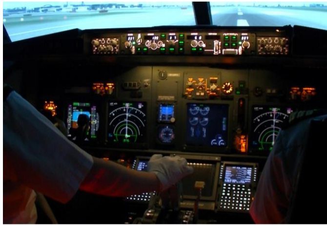
模擬フライトイメージ