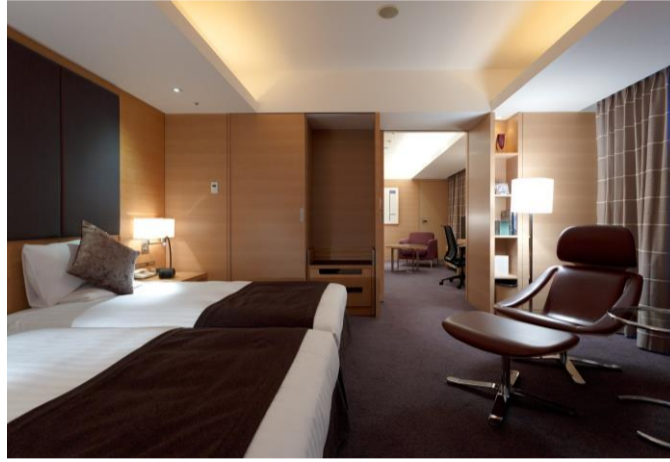
スイートツインルーム