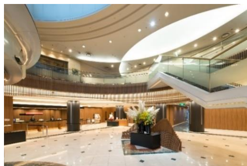
解放感溢れるロビー