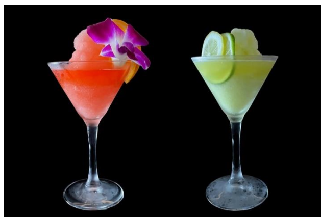
左：渋谷ライジングサン／右：渋谷フローズンストリーム

渋谷フローズンストリーム（画像：右）は、渋谷ストリームのイメージカラーであるストリームイエローを表現したフローズンスタイルのモクテル。パイナップルピューレ・アップル・オレンジ・ライムジュースなどをミキサーで混ぜ合わせ、レモン・ライムスライスを飾り付けたオリジナルモクテルです。