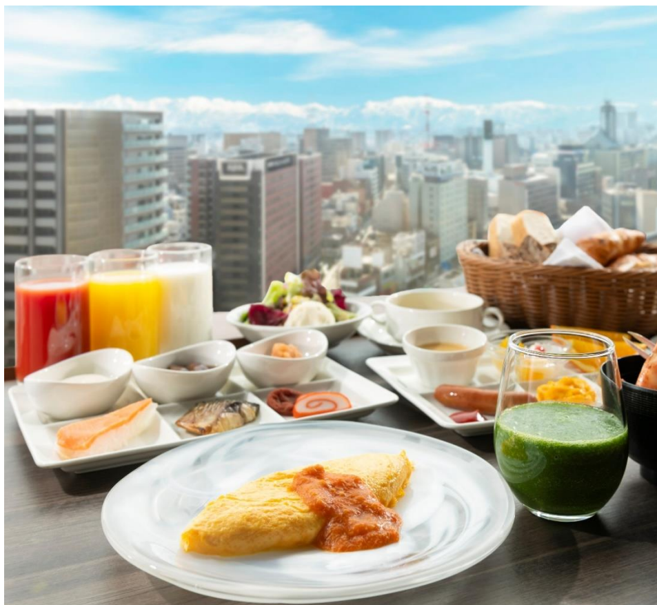
リニューアル後朝食ブッフェ