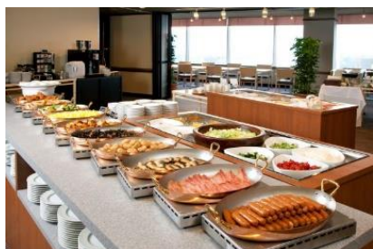
リニューアル前の朝食ブッフェ

https://www.tokyuhotels.co.jp/toyama-e/index.html