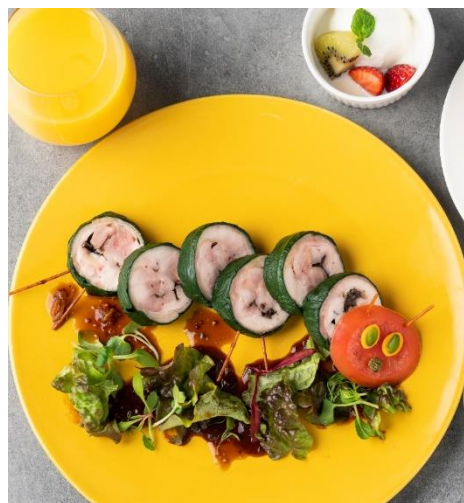
はらぺこあおむしプレート