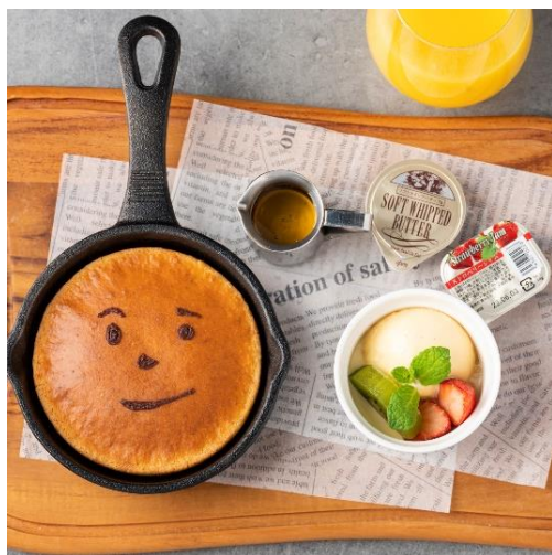
ホットケーキできあがり！