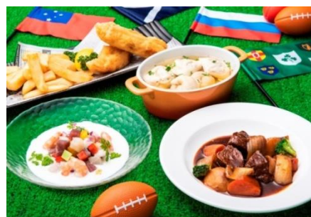
対戦国メニューイメージ