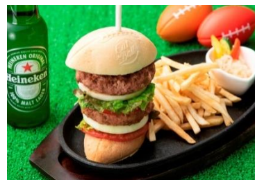
ラグビーバーガーイメージ

ミートプレート(ビーフステーキ・ラムチョップのソテー・骨付きソーセージ)、ソーセージと厚切りベーコンのグリル&フライドポテト ラグビーバーガー ほか