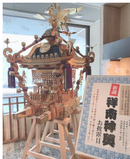
ロビーに展示中の祥南神輿 9/1まで

吉祥寺東急 REI ホテルが建つエリアの、吉祥寺南口商店会とパークロード商店会を中心とした有志で、今年も神輿を奉製。9月1日まで、新神輿のお披露目もホテルロビーにて行っております。