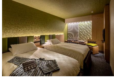
コンセプトツイン