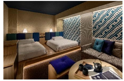
コンセプトデラックスツイン

■予約サイト https://www.tokyuhotels.co.jp/hakata-r/stay/plan