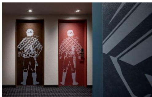
客室扉のイラスト

本プランは Go To トラベルキャンペーンの割引対象です。この機会にぜひ博多の魅力を感じてください。