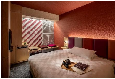
コンセプトシングル