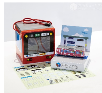
※「マイ車両工場」イメージ