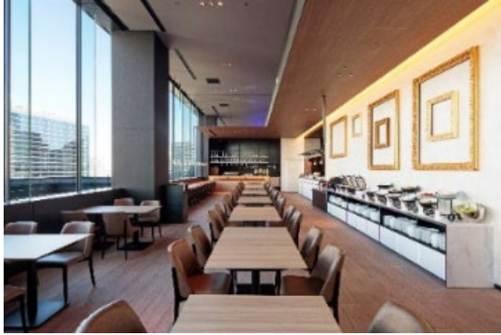
ビストロチャイナ「アンコール」内観