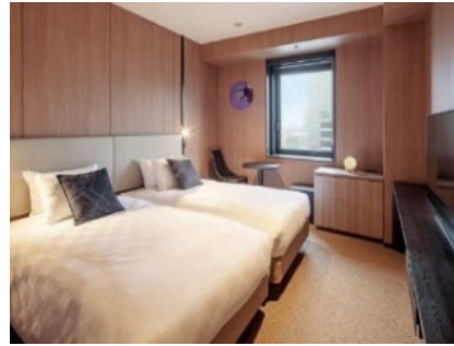
客室「スタンダードツイン」

※社会状況により営業時間等に変更が生じる可能性があります ※表示料金には消費税10%が含まれております ※食材の入荷状況により、メニューが変更になる場合がございます ※お米は国産米を使用しております ※写真はイメージです