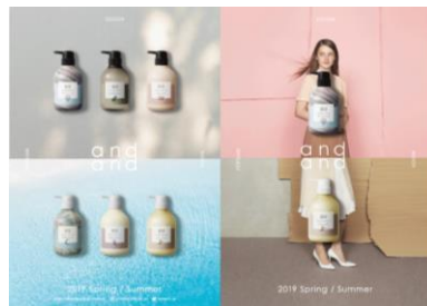
オリジナルブランドブック