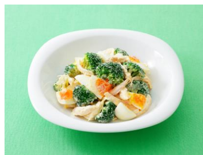
ブロッコリーとゆで卵とチキンのサラダ

※本品の摂取により疾病が治癒したり、多量摂取によってより健康が増進するものではありません。