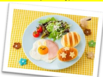
↑ Photo : ④うさぎとキャロットラベのイースターサラダ ⑤うさぎのハムエッグモーニングプレート