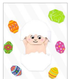
↑ Photo : おりがみで作るイースターエッグ

キューピー イースター特設サイト https://www.kewpie.co.jp/easter/