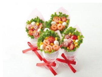
モッツアレラとプチトマトのカップブーケサラダ