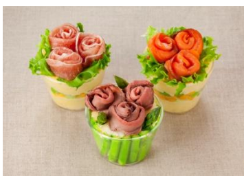
フラワーアレンジボテサラ