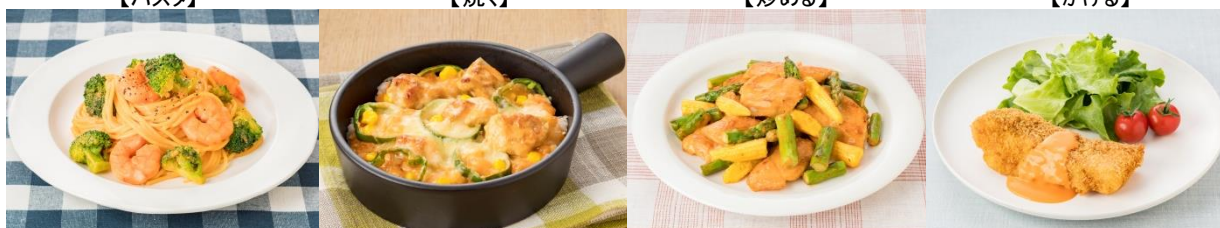
えびとブロッコリーの トマトクリームパスタ