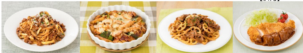
きのこのポロネーゼ