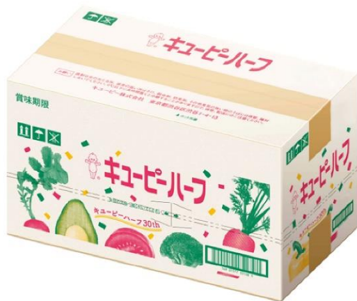
キューピーハーフ1ケース(300g×20本)