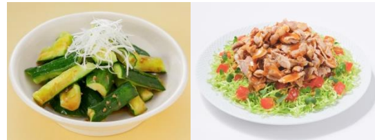
メニュー例: ㊦ごま油香る たたききゅうり、㊦豚こまの焼肉サラダ