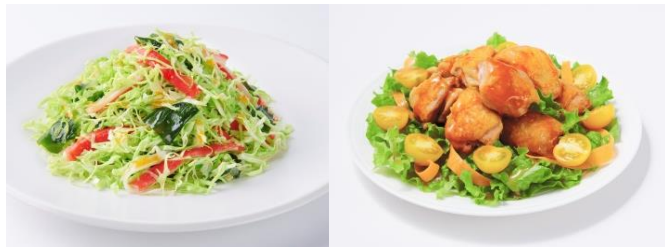
メニュー例：㊦キャベツとかにかまのあえサラダ、㊦チキンソテーサラダ