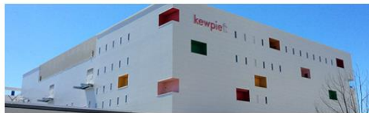
オープンキッチン(工場見学)

マヨネーズにまつわるさまざまな情報やトピックを体感しながら楽しく学べる見学施設(東京)です。