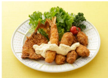
フライ盛り合わせ

「キューピー タルタルソース」は、定番のタルタルソースを家庭で手軽に楽しみたい人に向けて、卵のコクと玉ねぎの甘み、程よい酸味を絶妙なバランスで仕立てたタルタルソースです。タルタルソースが最も使用されているメニューはフライで、近年で