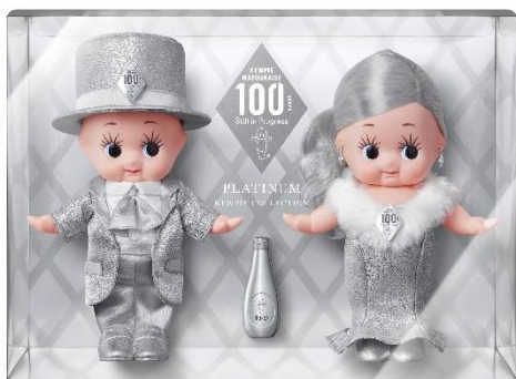
㊤ キュピ・コレ 2025 プラチナキューピーセット