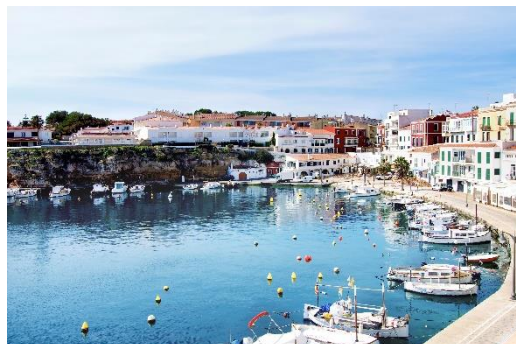
㊦ マヨネーズ発祥の地 スペイン メノルカ島 4泊6日ツアー