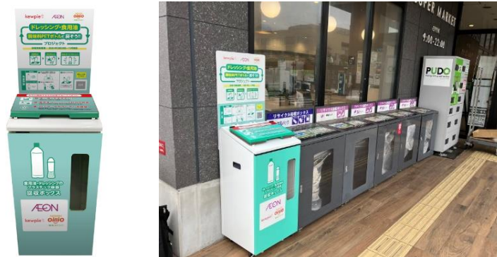
回収ボックス設置状況