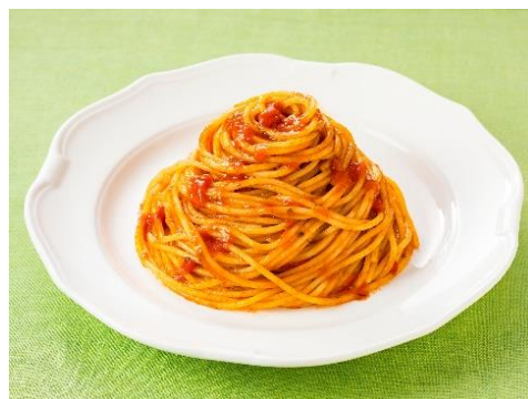
盛り付けイメージ

新商品「トマト&バジル 完熟トマト仕立て」は、素材の風味豊かなパスタソースです。キューピーが培ってきた素材のおいしさを引き出す技術で、トマトのフレッシュ感にこだわりました。また、香り立ちも追求し、国産バジルのこだわりのペーストを使用しました。口に入れた瞬間に、バジルの爽やかな香りが広がります。