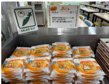
キューピーグループのサラダクラブが販売する パッケージサラダを従業員食堂で提供