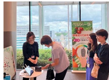
野菜摂取量チェックの様子