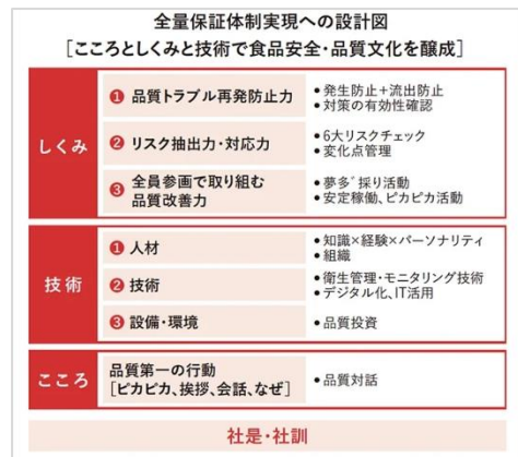
全量保証体制実現への設計図

※2 2000年5月に設立された非営利団体「GFSI（世界食品安全イニシアチブ）」により、食品安全の基準を満たしていると承認された認証規格。