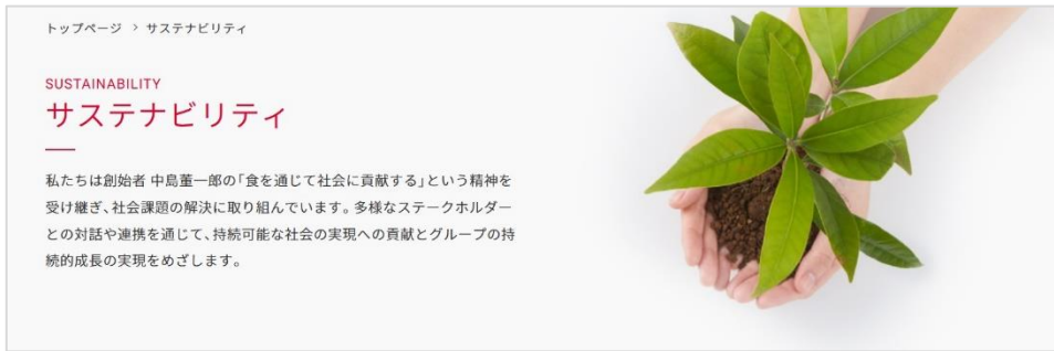
「サステナビリティサイト」トップ

■ 「サステナビリティサイト」 https://www.kewpie.com/sustainability/