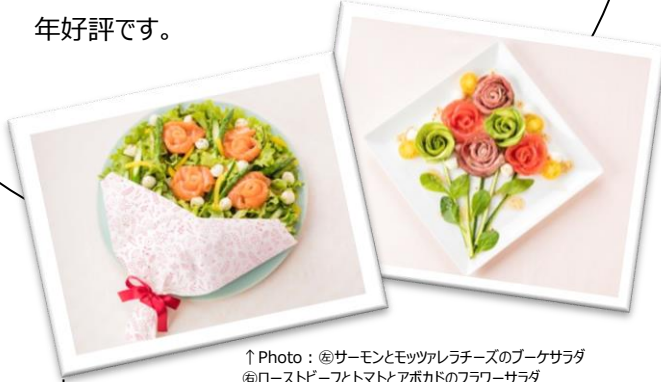
↑ Photo: ⑥サーモンとモツァレラチーズのブーケサラダ ⑥ローストビーフとトマトとアボカドのフラワーサラダ

ブーケサラダ特設サイト https://www.kewpie.co.jp/dressing/tasty/bouquet_salad/ とっておきレシピ 母の日特集 https://www.kewpie.co.jp/recipes/features/feature/41/