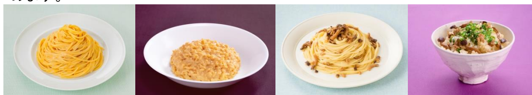
Photo：④から、「ウニクリームパスタ」、アレンジメニューの「ウニクリームリゾット」、「きのこバター醤油パスタ」、アレンジメニューの「きのこバター醤油ごはん」