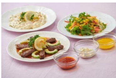
シェフおすすめレシピ 3 選

『Qummy 便り』 デリサラダソース https://qummy.kewpie.co.jp/journal/178