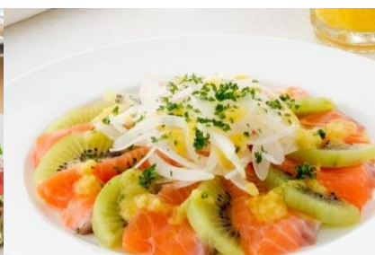
サーモンとキウイフルーツのデリサラダ (たまねぎとにんじん使用)