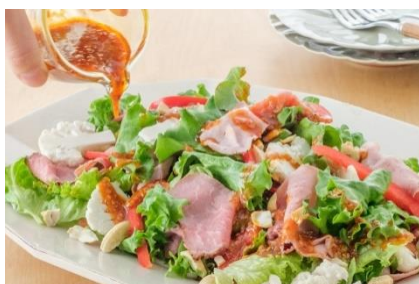
ローストビーフとカリフラワーのデリサラダ (パプリカとごま使用)