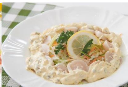
ほたてのサラダ仕立て (いんげんとピクルスのマヨ仕立て使用)