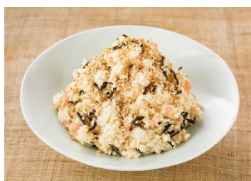
塩昆布とツナのおからポテサラ風