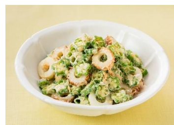
オクラとちくわの和風マヨ和え