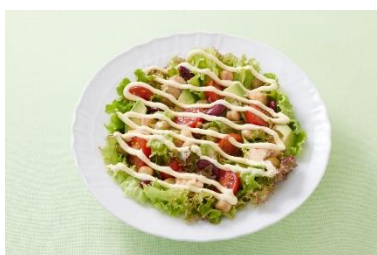
アボカドと豆とツナのサラダ