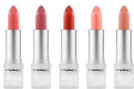
リップスティック 各3,300円(税抜)