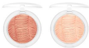
エクストラディメンション スキンフィニッシュ 各 4,900円(税抜)