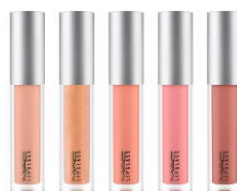
リップガラス 各2,900円(税抜)

M・A・C (メイクアップアートコスメティクス) お客様お問合せ先: 0570-003-770 WWW.MACCOSMETICS.JP