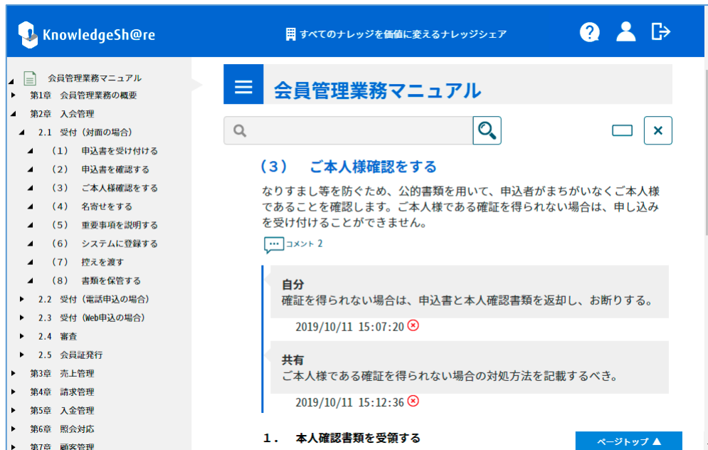
マニュアル利用者が目にする画面イメージ