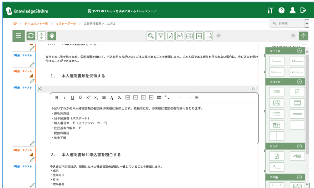
KnowledgeSh@re の編集画面イメージ

慎重な確認が必要な業務には、すべてのチェックボックスをチェックしないと次のページに移ることができないような制御を設定できます。マニュアルの手順に沿って、作業を進めさせたいとき、作業漏れ防止に有効です。