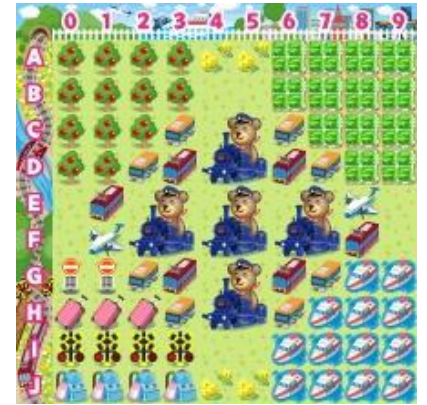
【乗り物コロカ旅なテーマ[昼]】

乗り物コロカ裏面のシリアル番号をコロニーな生活内でユーザが入力すると、各社オリジナルデザインのデジタルアイテム「●●●の模型」を獲得することができます（アイテム名が一部異なる交通事業者がございます。詳細は各交通事業者にお問い合わせください）。さらに「乗り物コロカ」入力で、各社ごとに用意された「デジタルスタンプラリー」に参加できます。指定された駅や観光地、デジタル上のお土産を集めるミッションをクリアすると、クリア数に応じて限定デジタルアイテム「乗り物コロカ旅なテーマ[昼][夕][夜]」や「乗り物コロカ旅金貨」などを獲得することができます。