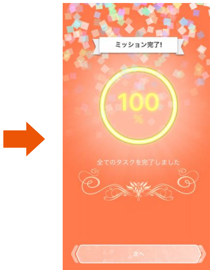
⑤ 「ミッション」クリアで「WALLET ポイント」ゲット