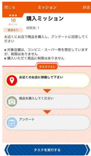
① ミッションを確認