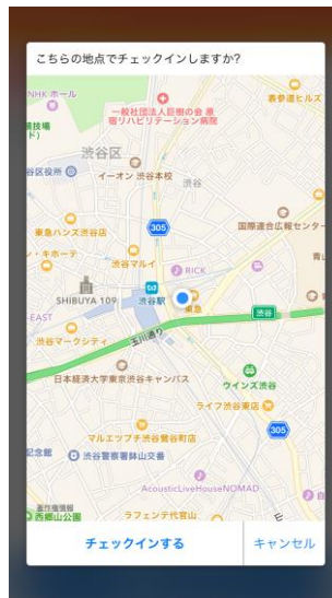
② 近くのお店でチェックイン