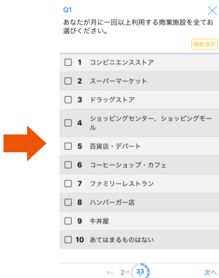
④ アンケートに回答