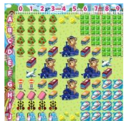
【乗り物コロカ旅なテーマ[昼]】

乗り物コロカ裏面のシリアル番号をコロニーな生活内でユーザが入力すると、各社オリジナルデザインのデジタルアイテム「●●●の模型」を獲得することができます (アイテム名が一部異なる交通事業者がございます。詳細は各交通事業者にお問い合わせください)。さらに「乗り物コロカ」入力で、各社ごとに用意された「デジタルスタンプラリー」に参加できます。指定された駅や観光地、デジタル上のお土産を集めるミッションをクリアすると、クリア数に応じて限定デジタルアイテム「乗り物コロカ旅なテーマ[昼][夕][夜]」や「乗り物コロカ旅金貨」などを獲得することができます。