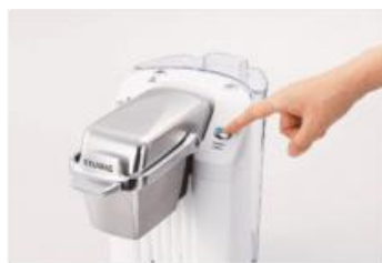
②抽出ボタンを押す