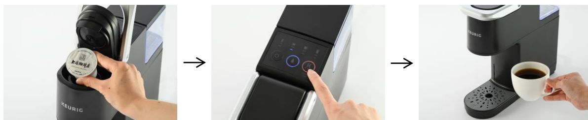
①お好みの K-Cup®を 専用マシンにセット