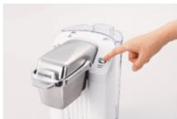
②抽出ボタンを押す