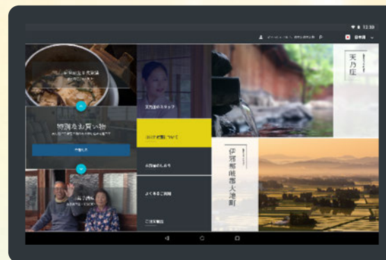
cocodakeのホーム画面イメージ

cocodakeは、旅館・ホテルの客室を物販の「ショールーム」として活用し、お客様に「ココだけ」でしか手に入らないモノ（伝統工芸や家具、調度品など）を実際に触ったり、使ったり、食したりして頂き、気に入ればすぐにタブレット端末を使って客室で購入が行える“体験「Eコマースツール」”です。