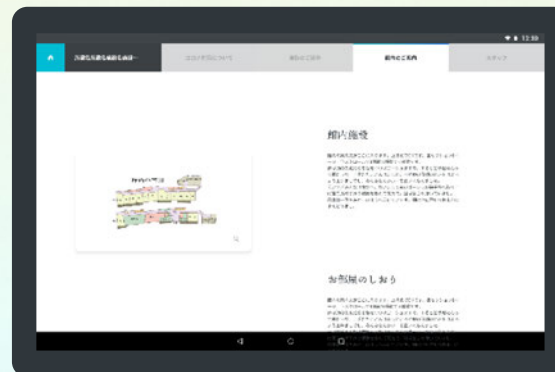
cocodakeの施設情報画面イメージ