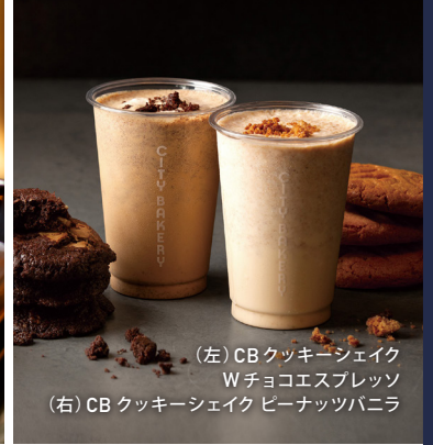
(左) CBクッキーシェイク Wチョコエスプレッソ (右) CBクッキーシェイク ピーナッツバニラ