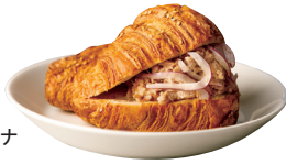
クロワッサンサンド ツナ

店内にはプレッツェルクロワッサンをはじめ、現地の味をそのままに再現したパンやクッキー、マフィンが並び、気分はまるでNY。日本オリジナルの商品も充実し、代官山で暮らす人、働く人が毎日訪れてもきっと欲しいパンが見つかるはずです。