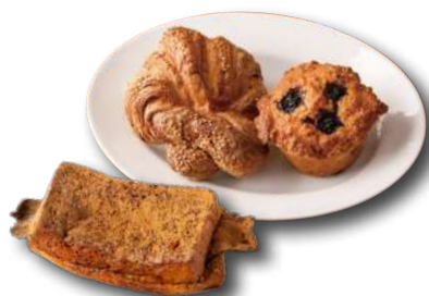
(左)フレンチトースト 450円 (税込486円) / (中央)プレッツェルクロワッサン 360円 (税込388円) / (右)ブルーベリーコーンマフィン 320円 (税込345円)

代名詞でもある「プレッツェルクロワッサン」をはじめ、パンやペイストリー、ケーキなど常時30~40種の個性豊かな商品を展開。毎日の食卓に並べたくなるような飽きのこない味わいの食事パンやテーブルロール、おやつ感覚でお楽しみいただける「チョコレートクロワッサン」など、様々なシーンでご活用いただける魅力あるラインナップです。すっきりとした味わいのオリジナルブレンドコーヒーは、パンとの相性も抜群! 施設内のスタジオや会議室などでもお楽しみいただけるように、THE CITY BAKERY初となるポットコーヒーサービスも提供します。その他、48時間漬け込んだシロップで作る自家製レモネード、ニューヨーカーも愛したリッチな味わいのホットチョコレートなど、ドリンクメニューもバリエーション豊かにご用意しております。