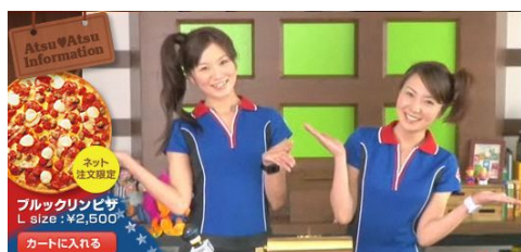
< ドミノオンライン本店 >