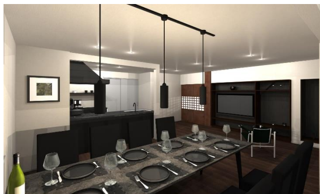
ダイニング & キッチン