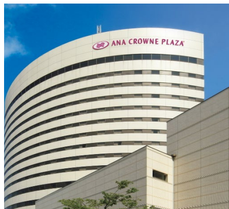
ANA クラウンプラザホテル新潟