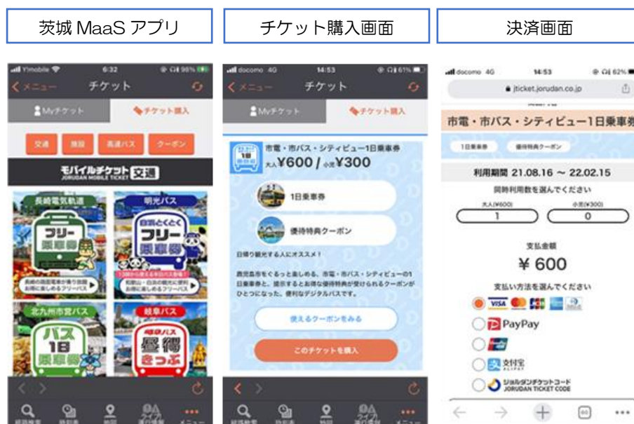
図. ジョルダン社の乗換検索アプリの購入・利用画面