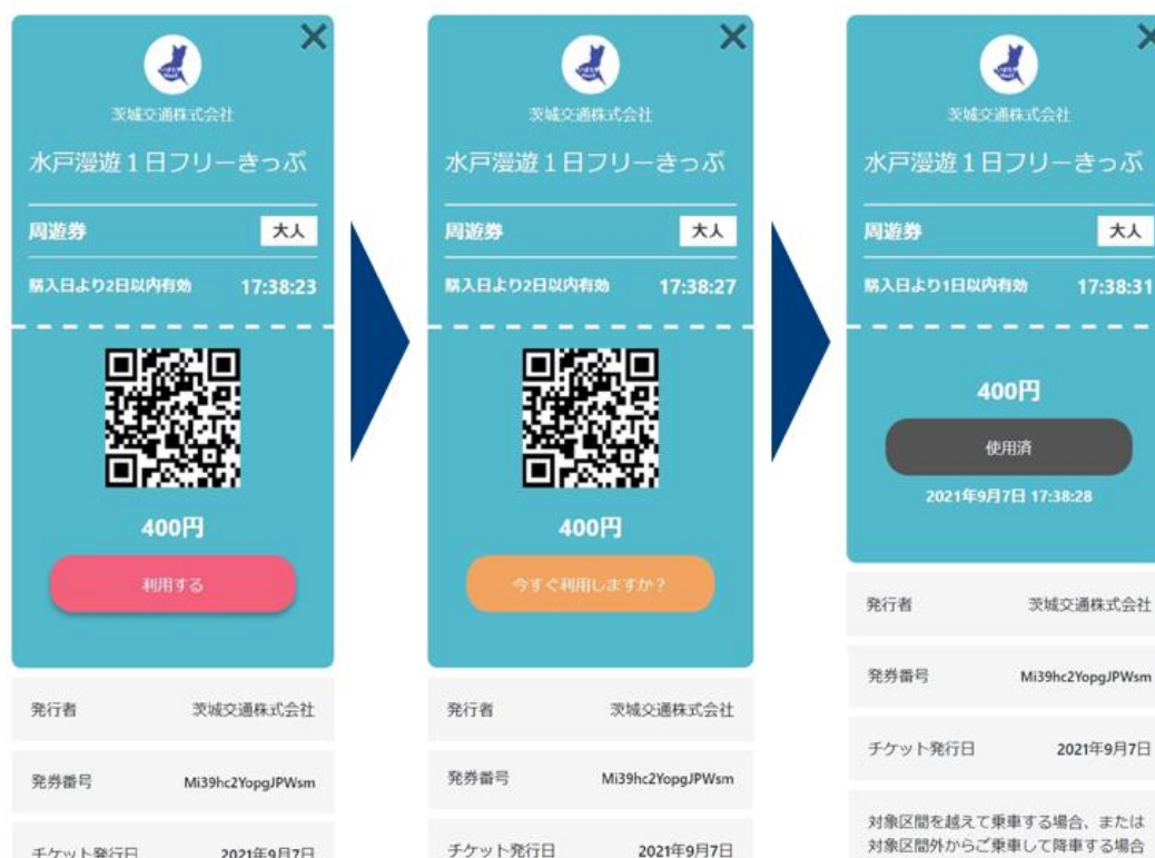
図. デジタルチケットの利用画面

購入したチケットはスマートフォン上で発行され、窓口などでの引き換え不要で、チケット操作をして画面を見せるだけでバスや鉄道にご乗車頂け、コロナ禍において安心してご利用頂けます。