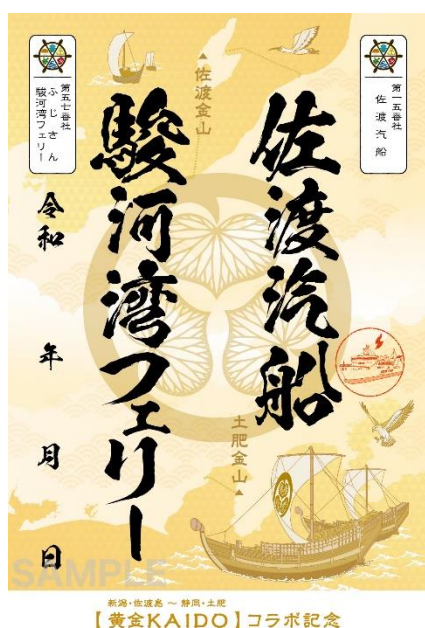
佐渡汽船での販売