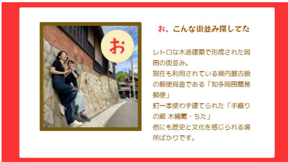
岡田いろはカルタスタンプラリーマップ