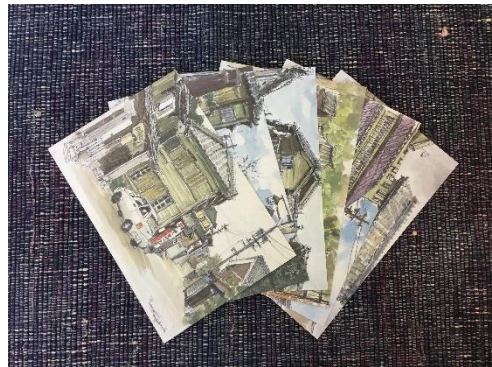
特典の絵はがきセットの画像