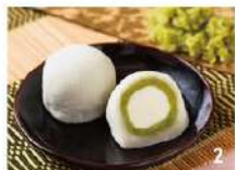
2.東北への復興支援から生まれた「ずんだ生クリーム大福」(200円)は幅広い年齢層に人気。

程よい酸味と白あんの甘さがたまらない「いちご大福」(250円)をはじめ、四季の和菓子もずらりと並び。