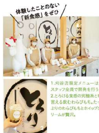
生地に香ばしいほうじ茶の粉が練り込まれている「ほうじ茶生わらびもち」。なめらかで柔らかな舌触りだ。

1.刈谷店限定メニューは、スタッフ全員で開発を行う。 2.とろける食感の究極系とも言える飲むわらびもち。たっぷりふりのわらびもちとホイップクリームが贅沢。