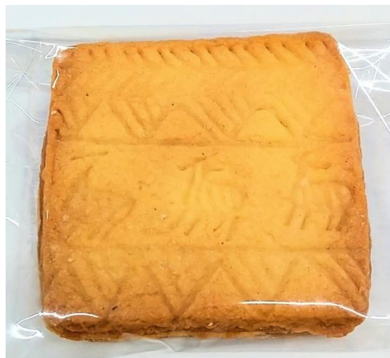
朝日遺跡 シカの線刻画クッキー